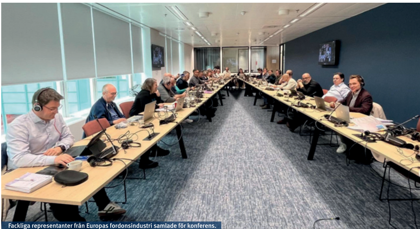
Fackliga representanter från Europas fordonsindustri samlade för konferens.

vecka sedan kunde vi läsa om förändringar i ledningsstrukturen i Kina, där en ny chef tillträtt med en tydlig inriktning och strategi: "Kina för Kina".