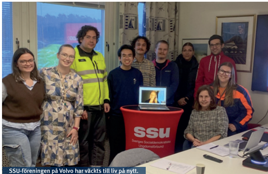
SSU-föreningen på Volvo har väckts till liv på nytt.

Årsmötet i mitten av mars blev en dag att minnas. Inte bara för att föreningen formellt återuppstod, utan för att his-