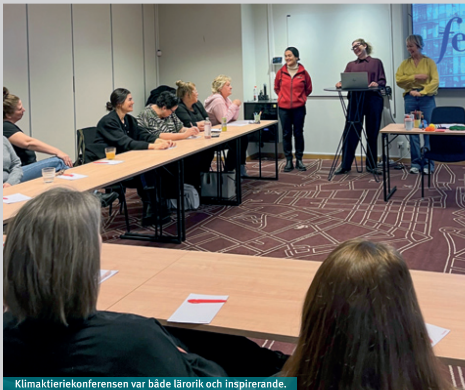
Klimakteriekonferensen var både lärorik och inspirerande.

Under konferensens planering lyftes frågan om en klimakteriepolicy på AMK (arbetsmiljökommitté.) Förslaget togs emot positivt och kommer nu att drivas vidare både lokalt och globalt.