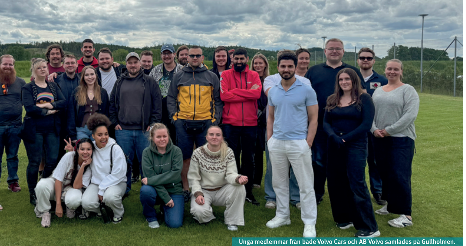
Unga medlemmar från både Volvo Cars och AB Volvo samlades på Gullholmen.