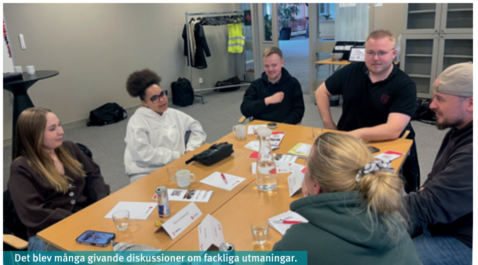
Det blev många givande diskussioner om fackliga utmaningar.

Trubaduren Rasmus Andersson tog oss tillbaka i tiden med hjälp av musik och poesi, där han berättar sin familjs