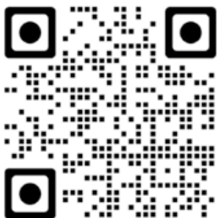
Göteborgs arbetares folkhögskola (GAF)

Förbundets hemsida där du hittar senaste nytt och information om de olika verksamhetsområdena inklusive studier.