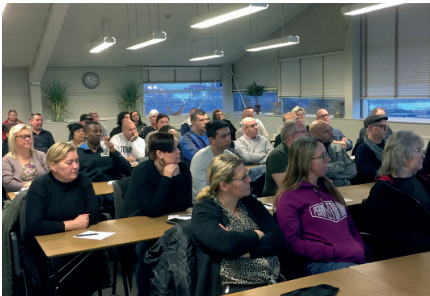
ECPAT arbetar för att förhindra exploatering av barn. En temadag om Grooming lockade flertalet medlemmar till Arken strax innan jul.