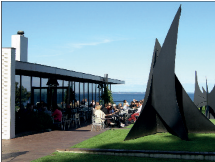
Konstmuseet Louisiana ligger strax söder om Helsingør med vacker utsikt över Öresund.